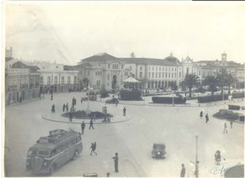
Vista da Praça D. Francisco Gomes (antiga Praça da Rainha) Século XX – 1942 17,40 cm x 23,50 cm Foto – 8650 Coleção Fotografia